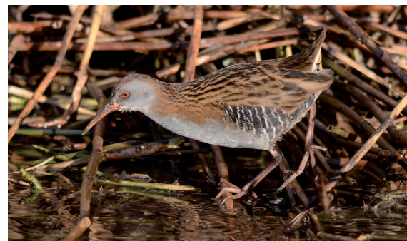
Porciglione ( Rallus aquaticus )