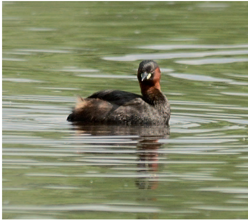
Tuffetto ( Thachybaptus ruficollis )