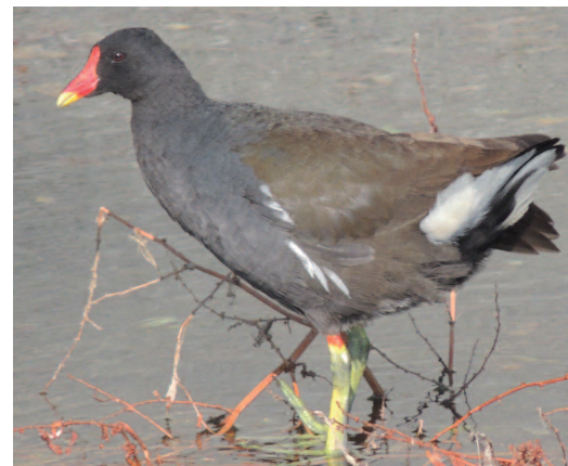
Gallinella d'acqua ( Gallinula chloropus )