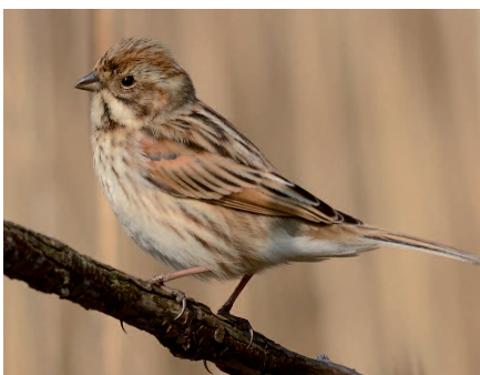
Migliarino di palude ( Emberiza schoeniclus )