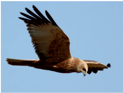
Falco di palude ( Circus aeruginosus )

N ell'area dello Zoc del Peric e territorio adiacente, tra il 2016 e il 2019, sono state osservate 110 specie di Uccelli, qui sotto elencate: