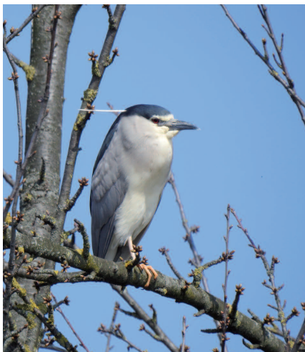
Nitticora ( Nycticorax nycticorax )